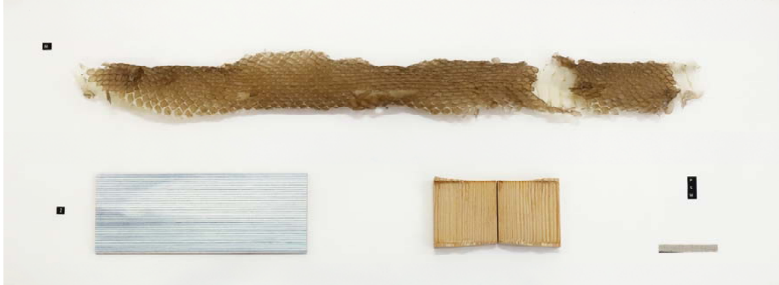
Naturgemälde corpus I. 2018. Madera, grafito y exuvia. 33 x 80 cm.

La palabra alemana "Naturgemälde" podría traducirse aproximadamente como "pintura de la naturaleza" o "cuadros de la naturaleza", al mismo tiempo que entraña una sensación de unidad o integridad de todo lo que se ve representado. Utilizado este término por el naturalista y geógrafo de principios del XIX Alexander Von Humboldt, hace referencia a sus personalísimos diagramas o mapas dónde trataba de representar todo lo medido en cada una de sus expediciones. En una sola lámina representaba de manera gráfica y condensada todos los datos referentes al estudio de un lugar determinado. Un microcosmos en una página.