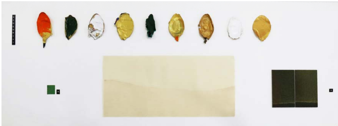
Naturgemälde corpus II. 2018. Acrílico, grafito y papel. 33 x 80 cm.

La pintura es naturaleza y al trabajar desde donde se desarrolla su lenguaje debemos cuidar que la parte racional no invada todo lo que no entendemos. Porque lo que no entendemos es lo único que tiene la posibilidad de enriquecer nuestro conocimiento. La naturaleza no son matemáticas, simplemente aplicamos el modelo matemático para entenderla de una determinada manera.